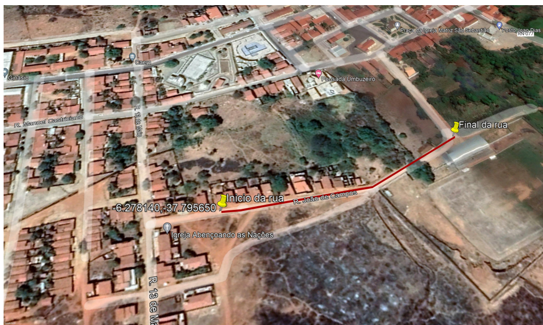
Figura 1: Localização Georeferenciada da rua João Campos.

A vistoria técnica na referido local aconteceu no dia 20 de janeiro de 2023, toda a extensão da rua foi vistoriada e realizado um levantamento das necessidades para o ambiente. As figuras 2a e 2b apresentam a situação atual da referida rua.