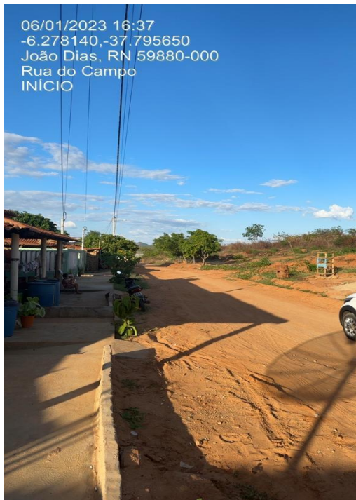
Figura 2a: inicio da rua.